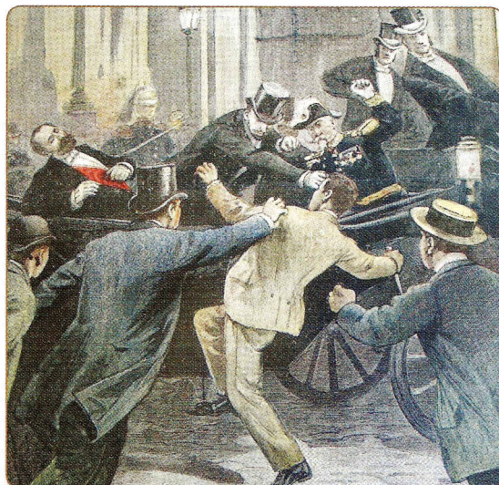
L'assassinat de Carnot marquera la population, au point que de nombreuses rues et places porteront son nom, telle l'actuelle place Guillaume Le Conquérant à Eu.