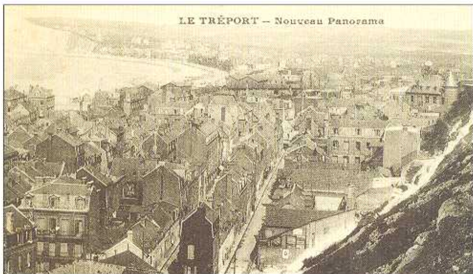
LE TRÉPORT — Nouveau Panorama