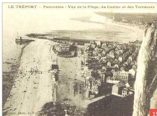
LE TRÉPORT — Panorama — Vue de la Plage, du Casino et des Terrasses

L'année dernière, elle a rejoint la croix rouge, et ce mercredi matin elle a rapidement répondu à l'appel lancé par la croix rouge pour se rendre quelque part en France afin d'y soigner activement les blessés et les malades.