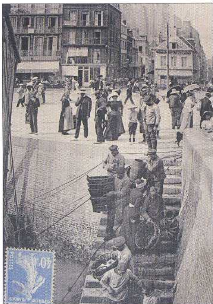
En 1898, bloquer les pêches c'est tout simplement bloquer le Tréport.